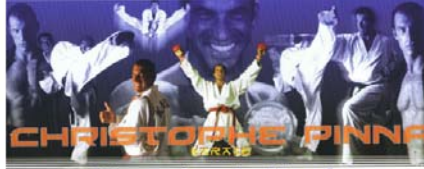
CHRISTOPHE PINNA Champion du Monde