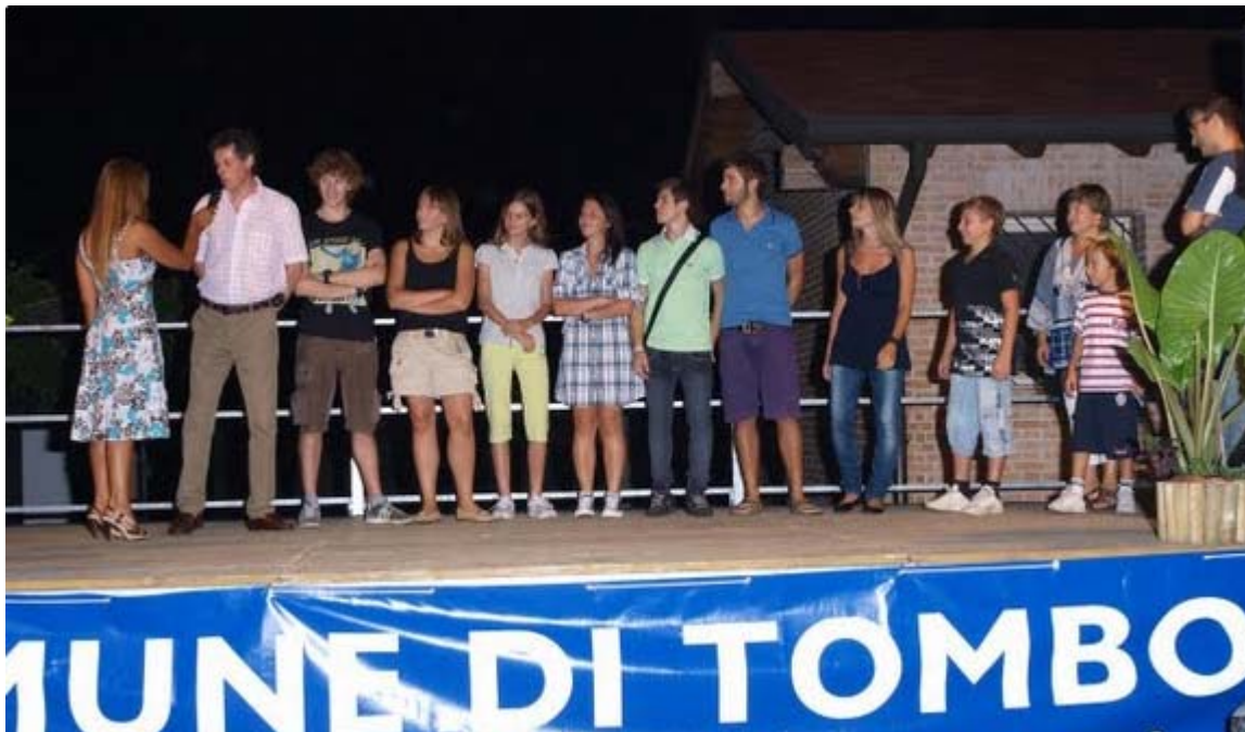
La nostra rappresentanza

sito internet : http://www.karatetombolo.it - email: info@karatetombolo.it