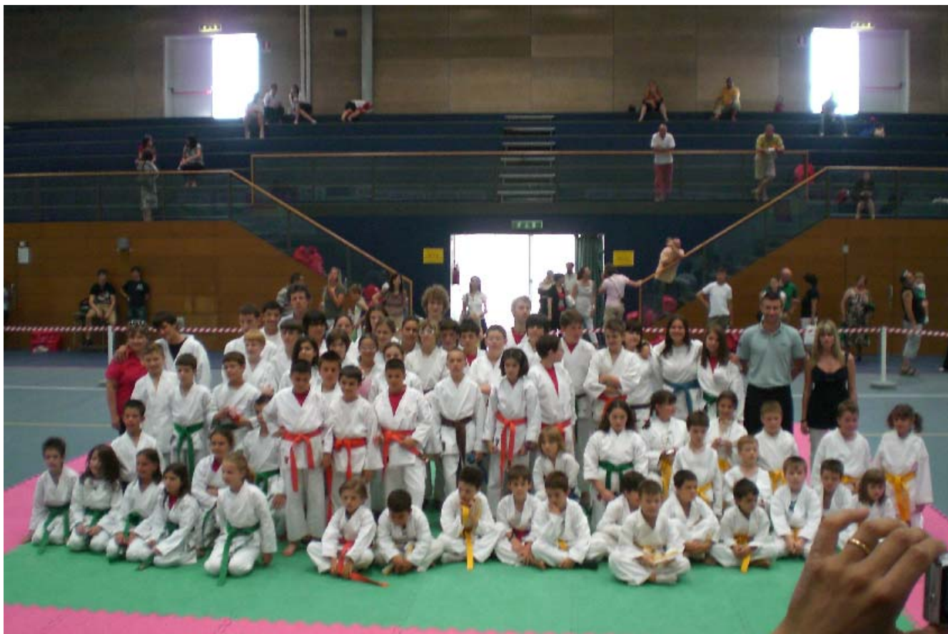
Foto di gruppo ... con fotografo.

sito internet : http://www.karatetombolo.it - email: info@karatetombolo.it