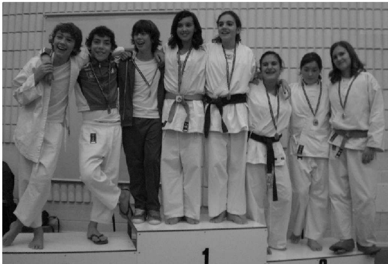
LA STREPITOSA SQUADRA AGONISTICA 1998